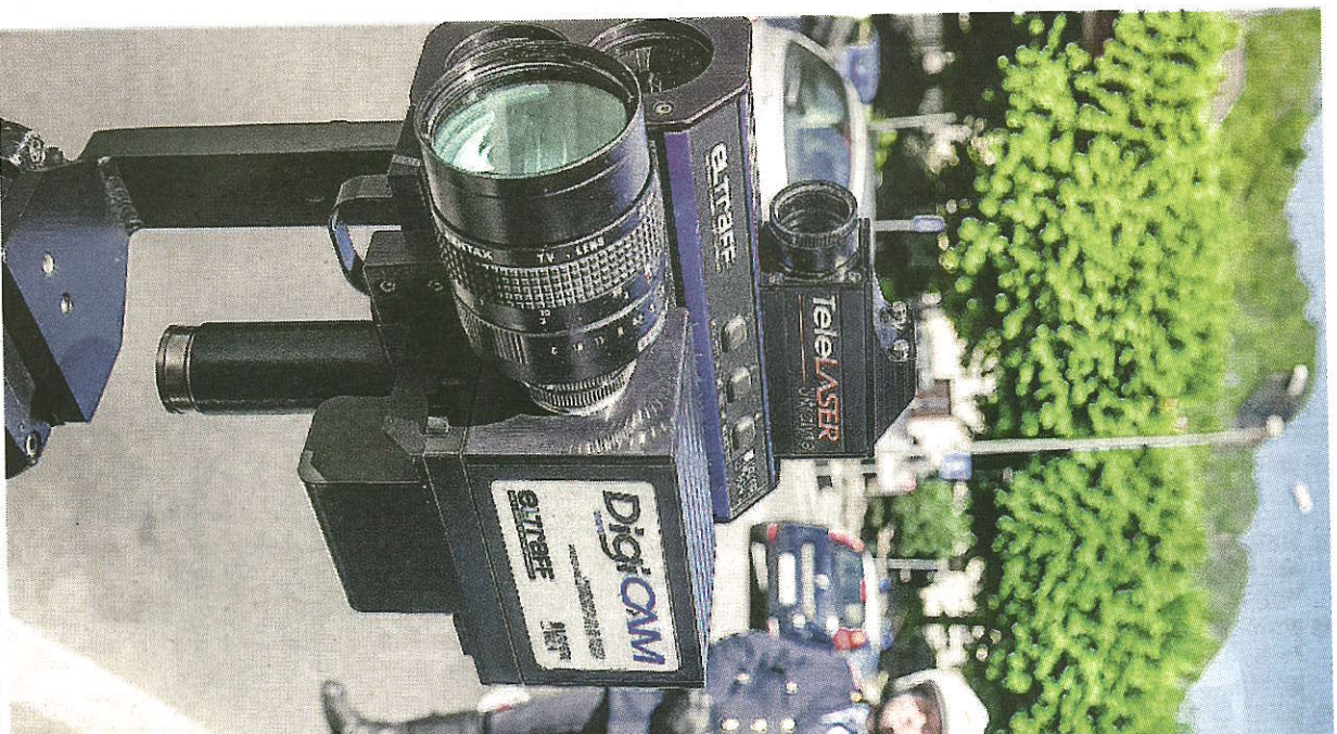
Controlli con dispositivi mobili sono stati effettuati in più occasioni